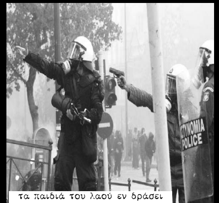
τα παιδιά του λαού εν δράσει

(2) Δεν αναφερόμαστε μόνο στο ΚΚΕ που η αγάπη του για τους συνδικαλιστικούς αγώνες των αστυνομικών είναι γνωστή σε όλους καθώς δεν υπάρχει μπατσο-διαδήλωση που να μην πάει να δηλώσει πως στηρίζει τα οικονομικά και θεσμικά τους αιτήματα , αλλά και στο ΣΥΡΙΖΑ που επιλέγει να γλύψει τους ένστολους φοιβάδες . Ο Αλαβάνος στη συνάντησή του με την Πανελλήνια Ένωση Αστυνομικών Υπαλλήλων στις 12 Δεκέμβρη ( εν μέσω εξέγερσης παρακαλώ ) όταν οι μπάτσοι είχαν ξαμοληθεί να κάνουν μαζικές συλλήψεις και να πνίγουν τον κόσμο στα χημικά, ήταν ξεκάθαρος: “δεν πιστεύουμε εμείς ότι όλοι οι αστυνομικοί είναι τραμπούκοι... αν η μία όψη του νομίσματος είναι ο νέος, ο οποίος μπορεί να ζει με ασφάλεια, με ελευθερία και με δημοκρατικά δικαιώματα, η άλλη του όψη είναι ο αστυνομικός πολίτης. Ο αστυνομικός, που αισθάνεται αξιοπρέπεια, ο αστυνομικός, ο οποίος είναι εκπαιδευμένος και ο αστυνομικός που λειτουργεί μέσα στην κοινωνία” .