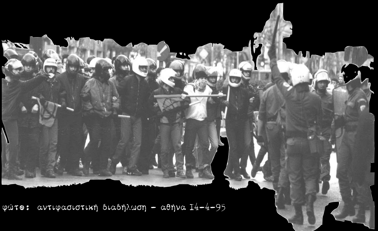
φώτο: αντιφασιστική διαδήλωση - αθήνα 14-4-95

φυλακές, πόλεμος, πρόσφυγες, εξαθλίωση, εργατικά "ατυχήματα", δολοφονίες μεταναστών, στρατόπεδα συγκέντρωσης, σχολικά κελιά, καταστολή, συστήματα η ΔΡΑΣΗ ΕΝΑΝΤΙΟΝ της παρακολούθησης, ρουφιάνοι, μισθωτή σκλαβιά φυλακές, πόλεμος, πρόσφυγες, εξαθλίωση, εργατικά "ατυχήματα", δολοφονίες μεταναστών, στρατόπεδα συγκέντρωσης, σχολικά κελιά, καταστολή, συστήματα παρακολούθησης, ρουφιάνοι, μισθωτή σκλαβιά