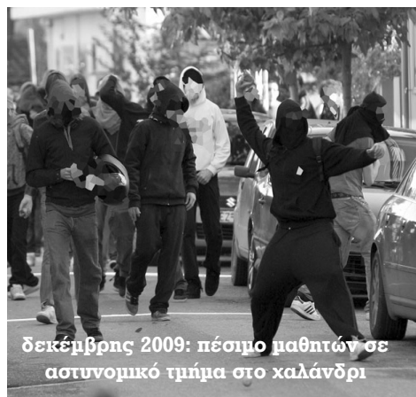
δεκέμβρης 2009: πέσιμο μαθητών σε αστυνομικό τμήμα στο καλάνδρι

βία απ' όπου κι αν προέρχεται απαντούν με τη δικιά τους βία στην υποβάθμιση της ζωής τους σε μίζερη και ρουτινιάρικη επιβίωση. Με μια βία που στρέφεται ενά-