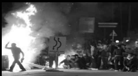
Αφغانοί στο λιμάνι της πάτρας, οργή και αξιοπρέπεια...

Ένα είναι το σίγουρο. Μέσα απ' το συγκεκριμένο νόμο το κράτος πλασάρεται με μια φιλομεταναστευτική-αντιρατσιστική εικόνα. Οι φασίστες (κάθε απόχρωσης) ουρλιάζουν για τον αφανισμό της ελληνικής φυλής ενώ το "αντιρατσιστικό" στρατόπεδο, η ροζ αριστερά (σύριζα ντε!), οι μκο και οι κάθε είδους ανθρωπιστές υπερασπίστηκαν το νόμο μαζί με την απαραίτητη αντιπολιτευτική σάλτσα του είδους "καλό αλλά λίγο". Έτσι συμφωνούν στο βασικό. Ότι αυτό το νομοσχέδιο συμφέρει έτσι γενικά και αόριστα τους μετανάστες. Μήπως όμως έχουν επιλεκτική μνήμη όλοι αυτοί; Πως αλλιώς μπορούμε να εξηγήσουμε το γεγονός ότι οι εξαγγελίες για το νομοσχέδιο (υπενθυμίζουμε ότι αυτές οι διατάξεις αφορούν μόνο τους νόμιμους μετανάστες) συνοδεύτηκαν ταυτόχρονα από εξαγγελίες για περισσότερη καταστολή, για τη δημιουργία περισσότερων στρατοπέδων συγκέντρωσης, δηλαδή ακόμα πιο πολλή υποτίμηση και περισσότερη εξάρτηση στα χέρια των μπάτσων, των κυκλωμάτων και των αφεντικών. Και εκεί είναι η ουσία του νομοσχεδίου: ενώ δίνει κάποια ψίχουλα σε μια πολύ μικρή μερίδα μεταναστών ταυτόχρονα ρίχνει περαιτέρω την μεγάλη πλειοψηφία στην παρανομία. Μεγαλώνει δηλαδή το χάσμα ανάμεσά τους.