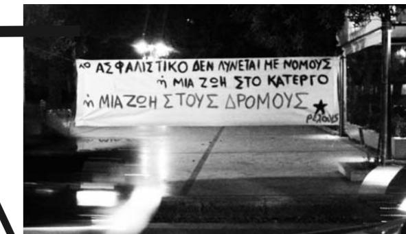
πανό που αναρτήθηκαν στην πόλη από την ομάδα με αφορμή τις απεργειακές κινητοποιήσεις του μαρτίου

Η παραπάνω όμως συμφωνία, δεν είναι ακριβώς συμφωνία. Είναι εκβιασμός για τους εργάτες, αλλή και μια δυναμική αυτών απέναντι στα αφεντικά τους. Βρέθηκε λοιπόν αυτό το προσωρινό σημείο ισορροπίας το οποίο όμως ως δυναμικό σημείο μπορεί να γείρει προς τη μια ή την άλλη μεριά. Και από ένα σημείο και μετά έγειρε τελείως προς τη μεριά των αφεντικών! Τι εννοούμε εδώ. Εννοούμε ότι τα αφεντικά δεν θέλουν μόνο να αποσπούν όση μεγαλύτερη υπεραξία από τους εργάτες μπορούν, συμπυκνώντας την εργασία χρονικά, αλλή όποτε τους παίρνει θέλουν να βάζουν και χέρι και στους μισθούς μας. Ξεκίνησαν από την περικοπή του έμμεσου μισθού που είναι οι παροχές που αναφέραμε παραπάνω, με το να κόβουν τη δωρεάν εκπαίδευση, τη δωρεάν ιατρική περίθαλψη, την ιδιωτικοποίηση των δημόσιων χώρων κτλ. Αυτά έχουν ήδη γίνει και ήδη ο μισθός έχει χάσει μέρος από την αξία του.