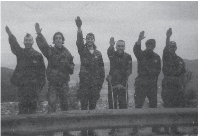
Πάνω: Οι έλληνες εθελοντές του σερβο-βοσνιακού μετώπου, χαιρετούν ναζιστικά και δεξιά: η αντιπετώπιση που είχαν από τα μμε στην πατρίδα...