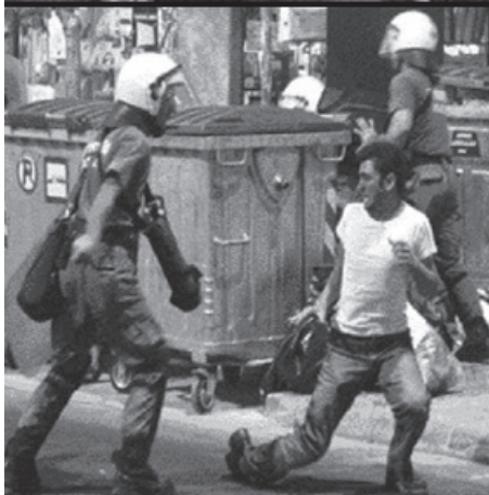
Το πανελλαδικό πογκρόμ εναντίον των Αλβανών στις 4/9/04, μετά τον ποδοσφαιρικό αγώνα Αλβανίας - Ελλάδα

Η κρυφή διαδικασία εθνικιστικής και ρατσιστικής μετάλλαξης δεν είχε πλέον κανένα λόγο να είναι τέτοια (κρυφή). Οι μάσκες είχαν πέσει και οι διαθέσεις είχαν φανεί: «Δεν θα μας κουνηθεί κανείς.»