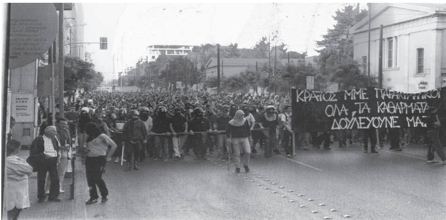
Από την αντιφασιστική πορεία στην Αθήνα στις 19/5/05

Μέσα στο καλοκαίρι κυκλοφορεί η είδηση γύρω από τις προθέσεις της Χρυσής Αυγής να διοργανώσει στη Ελλάδα πανευρωπαϊκό νεοφασιστικό camping με τον τίτλο «φεστιβάλ του μίσους». Στις 15.9.2005 πραγματοποιείται αντιφασιστική πορεία στη Πάτρα και δύο μέρες αργότερα στη Καλαμάτα. Την ίδια μέρα και ενώ το camping των νοσταλγών του Χίτλερ, του Μουσολίνι και των ταγματασφαλιτών έχει αναβληθεί υπό το βάρος των πιέσεων, οι νεοφασί της Χρυσής Αυγής μαζί με ελάχιστους ευρωπαίους ομοϊδεάτες τους θα κατασκοηνώσουν... στα γραφεία τους και στην οδό Γ Σεπτεμβρίου φρουρούμενοι από ισχυρές αστυνομικές δυνάμεις. Στη γύρω περιοχή, από την Ομόνοια ως το Πολυτεχνείο και τα Εξάρχεια, έχουν συγκεντρωθεί αναρχικοί, αυτόνομοι, αντιεξουσιαστές και αριστεριστές ακυρώνοντας στην πράξη την πρόθεση των νεοφασί να πορευτούν στο κέντρο της πόλης.