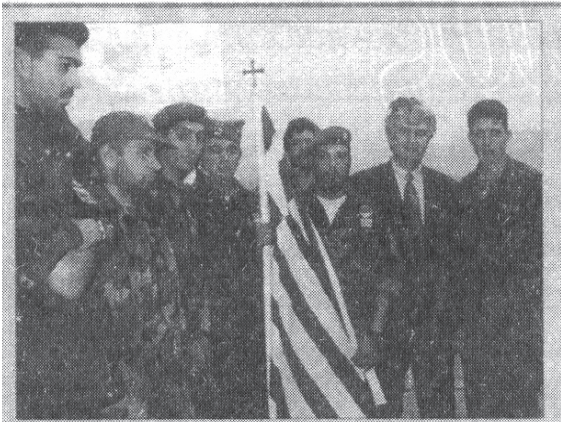
Οι Έλληνες εθελοντές που πολεμούν στη Βοσνία ύψωσαν και την ελληνική σημαία στη Σρεμπρένιτσα. (Φωτογραφία αρχείου: Οι Έλληνες εθελοντές με τον Ρ. Καρατζίτς)