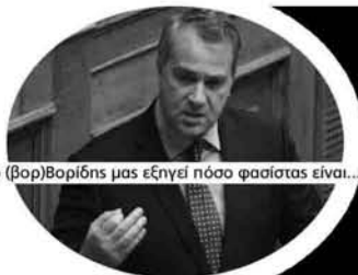
ο (Βορ)Βορίδης μας εξηγεί πόσο φασίστας είναι...

*Εκτός από τις δηλώσεις του Βορίδη τη δουλειά της έχει κάνει και η μιντιακή προπαγάνδα με τον έμπολο, φορείς του οποίου θεωρούνται αποκλειστικά και μόνο μετανάστες, με αποτέλεσμα να μένουν χωρίς ιατροφαρμακευτική περίθαλψη οι μετανάστες καθώς πολλοί φοβούνται ότι θα κολλήσουν έμπολο (άσχετα αν ακόμα και το ΚΕΕΛΠΝΟ διαψεύδει κάτι τέτοιο).