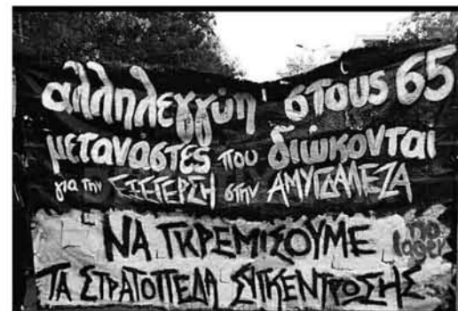
φωτογραφία από την πορεία αλληλεγγύης που διοργανώθηκε στην Αθήνα στις 31/10

Στους 2 κατά μέσο όρο κάθε μήνα ανέρχονται οι νεκροί από φυματίωση στις φυλακές κορυδαλλού αναφέρουν οι κρατούμενοι. Ο εξευτελισμός της ανθρώπινης αξιοπρέπειας συνεχίζεται, καθώς οι γιατροί είναι ανύπαρκτοι και οι μπάσοι μεταφέρουν τους ασθενείς στο νοσοκομείο λίγο πριν πεθάνουν, μόνο και μόνο για να μην πούνε ότι πέθαναν στη φυλακή. Αυτή είναι η καθημερινότητα για όσους προέρχονται από τα κατώτερα στρώματα της ταξικής ιεραρχίας. Μην ξεχνάμε ότι οι θάνατοι των κρατούμενων στις φυλακές, στην πραγματικότητα είναι κρατικές δολοφονίες, όπως οι θάνατοι των μεταναστών στα σύνορα, και πως όσο η κοινωνία συναινεί με την αδιαφορία της τόσο θα αυξάνεται ο αριθμός αυτών που θεωρούνται ότι περισσεύουν. Και αλίμονο σε αυτούς που θα κριθούν ότι περισσεύουν.