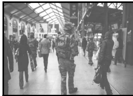
Γάλλοι στρατιώτες περιπολούν ανάμεσα σε πολίτες σε σιδηροδρομικό σταθμό του παρισιού το νοέμβριο του 2015. Έτσι για να συνθηθίζουμε...

τρόπους. Π.χ. σχεδόν σε κάθε περίπτωση ληστείας πετάγαν ένα "ο δράστης μιλούσε σπαστά ελληνικά" και άφηναν τον κάθε ρατσιστή να κάνει τους υπόλοιπους συνειρμούς, ή όταν γινόταν μια ληστεία ανέφεραν