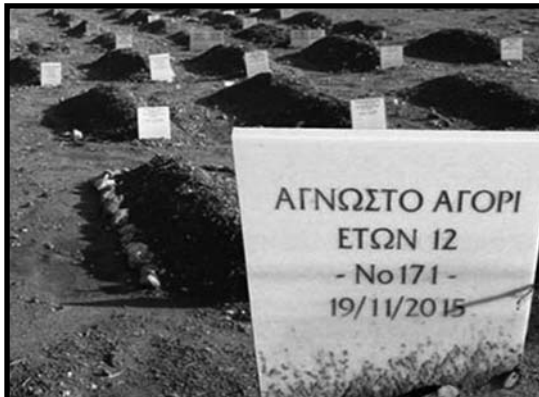
Νεκροταφείο μεταναστών στη Λέσβο. Όπως φαίνεται και από την ημερομηνία θανάτου (αυτή είναι που αναγράφεται στις πλάκες), οι δολοφονίες μεταναστών στα σύνορα συνεχίζονται και με τη νέα κυβέρνηση αφού αυτός δεν παύει να είναι ο καλύτερος και αποτελεσματικότερος τρόπος αποτροπής για το ελληνικό κράτος.

ευρωπαϊκή ένωση (μπας και διαπραγματευτούν καλύτερα τους θανάτους μεταναστών στα σύνορα και -ανάμεσα σε άλλα- πάρουν και κανά φράγκο παραπάνω), πότε την τουρκία που δεν κρατάει τους μετανάστες στο έδαφός της (2) (είπαμε, η τουρκία είναι προαιώνιος εχθρός και φταίει για όλα), πότε τη frontex και το νατο (ειδικά αν είσαι αντιιμπεριαλιστής και ψάχνεις τον εχθρό σου κάπου μακριά, λες και η Ελλάδα εν τω μεταξύ δεν είναι μέλος της frontex και του νατο και δε ζήτησε η ίδια τη συμβολή τους). Και κάπως έτσι φτάνουμε στο σημείο να θεωρούνται και αλληλέγγυοι στους μετανάστες οι λιμενικοί από μια “προοδευτική” εφημερίδα όπως αυτή των συντακτών. Βέβαια τώρα έχει αλλάξει και κυβέρνηση, κι εκεί που παλιά πολλοί θα κατηγορούσαν τους λιμενικούς (ή έστω θα ήταν καχύποπτοι απέναντί τους) για δολοφονίες μεταναστών όπως αυτή που έγινε στο Φαρμακονήσι (3) το γενάρη του 2014 με δεξιά κυβέρνηση, τώρα θα κάνουν την