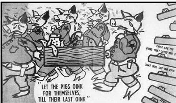
Αυτό το σκίτσος όπως και όλα τα υπόλοιπα σε αυτό το άρθρο είναι του Emory Douglas, σκιτσογράφου των Black Panthers.

Αποσπάσματα από άρθρα του αναρχικού από την Ιταλία Ερρίκο Μαλατέστα σχετικά με το ζήτημα της βίας. Για περισσότερα επισκεφτείτε την αυτοδιαχειριζόμενη δανειστική βιβλιοθήκη της ΑΝΑΤΟΠΙΑ ή επικοινωνήστε μαζί μας.