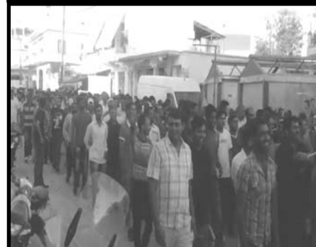
Σκάλα Λακωνίας, ιούλης 2014. Οι μετανάστες εργάτες γης από το πακιστάν απεργούν και διαδηλώνουν μες στην πόλη. Πάλι κόντρα στις αντίξοες συνθήκες και το μύθο που τους θέλει φουκαράδες.

όπλο το διάχυτο ρατσισμό εναντίον των μεταναστών εργατών. Αυτό οφείλεται και σε λόγους αδυναμίας για κάποιο κινηματικό κόσμο, αλλά και σε λόγους συμφέροντος για κάποιους άλλους. Θα επανέλθουμε παρακάτω.