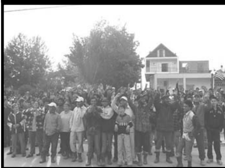
Μανωλάδα, 2008. Οι μετανάστες εργάτες της κατεβαίνουν σε απεργία ζητώντας αύξηση στο μεροκάματο, κόντρα στις γνωστές αντίξοες συνθήκες.

στην πλεία όπου επισκέφτηκε τους τραυματίες και δήλωσε ότι "Αυτό που συνέβη εδώ όχι μόνο αντίκειται στη νομιμότητα, αντίκειται ευθέως στην ιδέα της ανθρωπιάς. Είναι παντελώς απαράδεκτο και δεν έχει καμία σχέση με την ευρύτερη κουλτούρα του ελληνικού λαού και της ελληνικής κοινωνίας". Ο δένδιας καταγγέλλει ένα "ακραίο σκηνικό" και 2-3 άτομα για να βγάλει λάδι όλο τον υπόλοιπο ελληνικό λαό. Και είμαστε σίγουροι ότι πολλοί είναι αυτοί που συμφώνησαν και συμφωνούν ακόμα μαζί του καθώς το "οι έλληνες δεν είναι ρατσιστές" είναι βασικό ιδεολογικό μόντο, ακόμα και για ιδεολογικούς αντιπάλους του δένδια (πλην εξίσου ψηφοθήρες). Και για να καταλάβουμε το μέγεθος του θράσους του, όταν έκανε αυτές τις δηλώσεις μαζί του είχε και τον αρχηγό της ΕΛΑΣ Ν. Παπαγιαννόπουλο ο οποίος 4 μήνες πριν είχε ομολογήσει αυτό που όλοι ξέρουμε ότι κάνει η αστυνομία στους μετανάστες, λέγοντας χαρακτηριστικά ότι πρέπει να κάνουμε το βίο αβίωτο στους μετανάστες προκειμένου να τους αποτρέψουμε να έρχονται Ελλάδα. Αποκαλύπτοντας την