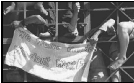
Ανήλικοι μετανάστες στο κέντρο κράτησης της Παγανής Λέσβου το 2009. Στο πανί γράφει “we want freedom, we don't want food”. Σταθεροί μέχρι σήμερα οι μετανάστες στο τι ζητάνε. Για πολλά μπορούν κάποιοι σκατόψυχοι να τους κατηγορήσουν, αλλά πάντως όχι για ασυνέπεια.