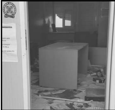
Από την τελευταία εξέγερση των φυλακισμένων μεταναστών στη Λέρο.

μπορεί να τους δεχτεί ο μέσος έλληνας μαλάκας. Σύμφωνα με το ρατσιστάκο μας, οι σύριοι -κατά κύριο λόγο- πρόσφυγες μπορούν να έχουν μισή ευκαιρία να προσπαθήσουν για άσυλο γιατί “έφυγαν από πόλεμο και κινδυνεύει η ζωή τους” ενώ οι μετανάστες καμία αφού παρουσιάζονται κάπως σαν άνθρωποι που κυνηγούν την περιπέτεια και ήρθαν να μας κλέψουν την καλοπέραση. Ο ρατσιστάκος δε θα κάτσει να σκεφτεί ότι αυτό που ωθεί τον άλλο να σηκωθεί και να φύγει από τη χώρα που μένει και να παίξει τη ζωή του κορώνα-γράμματα δεν είναι κάποια αγάπη για τα extreme sports, αλλά η ανάγκη για όσο το δυνατόν πιο αξιοπρεπή και καλή επιβίωση (αν όχι για σκέτη επιβίωση που είναι το πιο πιθανόν). Δε θα κάτσει να το σκεφτεί γιατί δεν τον νοιάζει. Αυτός απλά δε θέλει μετανάστες