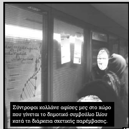
Σύντροφοι κολλάνε αφίσες μες στο χώρο που γίνεται το δημοτικό συμβούλιο Ιλίου κατά τη διάρκεια σχετικής παρέμβασης.