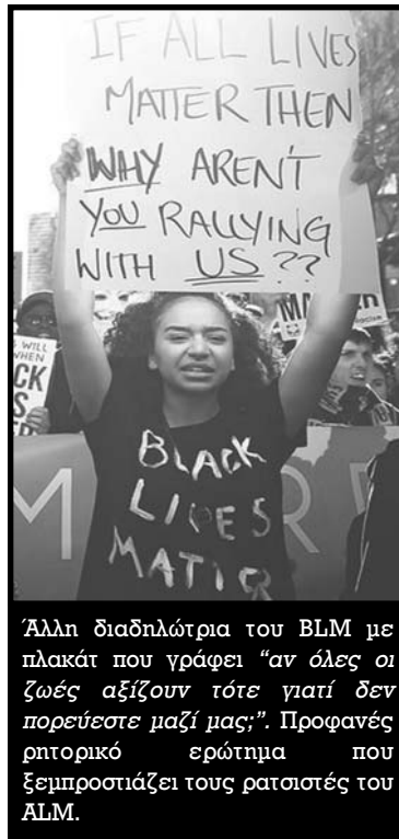
Άλλη διαδηλώτρια του BLM με πλακάτ που γράφει “αν όλες οι ζωές αξίζουν τότε γιατί δεν πορεύεστε μαζί μας;”. Προφανές ρητορικό ερώτημα που ξεμπροσιάζει τους ρατσιστές του ALM.

περί “ρατσισμού από την ανάποδη”, μόνο και μόνο για να μη μιλήσουμε για το “ρατσισμό από την ορθή”. Πόσες φορές δεν έχουμε ακούσει “κριτικές” ότι μιλάμε για τα δικαιώματα των μεταναστών ενώ για τους ντόπιους δε λέμε κάτι ή ότι ενδιαφερόμαστε μόνο για τους μετανάστες; Άνθρωποι που κάνουν τέτοιες ερωτήσεις πιστεύουμε ότι θα ήταν ικανοί στη χιτλερική γερμανία να εγκυβιάζουν αλληλέγγυους γερμανούς πολίτες γιατί υπερασπίζονταν τα δικαιώματα των εβραίων. Λοιπόν, πέρα από τους απλουστευτικούς και αφηρημένους ορισμούς του ρατσισμού που περισσότερο ταιριάζουν σε έκθεση της γ’ γυμνασίου θα το πούμε όσο πιο καθαρά μπορούμε: ο ρατσισμός δεν είναι απλά ένα αίσθημα εκθρότητας ή μίσους για κάποιους άλλους, δεν είναι απλά κάτι που είναι κακό και δεν πρέπει να υπάρχει και μπλα μπλα μπλα, αλλά μια κοινωνική σχέση κυριαρχίας κάποιων εις βάρος κάποιων άλλων η οποία διασφαλίζει ΠΡΟΝΟΜΙΑ για κάποιους τα οποία δεν αναγνωρίζει σε κάποιους άλλους. Ο ρατσισμός συστηματικά ευνοεί κάποιους και από την άλλη καταπιέζει, αποκλείει και περιθωριοποιεί κάποιους άλλους. Και όλοι αυτοί οι άλλοι είναι πολύ συγκεκριμένοι στην εκάστοτε χωρική και χρονική συγκυρία. Στην αμερική είναι οι μαύροι που δέχονται ρατσισμό και ό,τι αυτός συνεπάγεται σε υλικό επίπεδο, στη γαλλία είναι οι αλγερινοί κατά κύριο λόγο