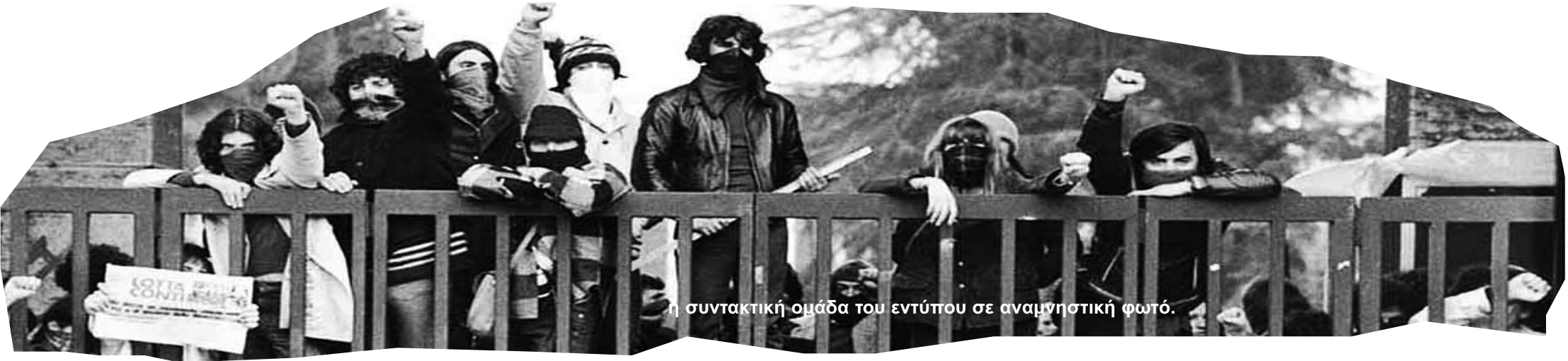
η συντακτική ομάδα του εντύπου σε αναμνηστική φωτο.