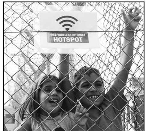
άντε να εξηγήσεις στα παιδιά πως πρόκειται για συνωνυμία. Από hotspot σε hotspot τους πάει ο Συριζα

σου και από αυτήν την πλευρά του περάσματος των μηνυμάτων είναι και αυτό σημαντικό σε αυτή την προσπάθεια”. Σαφέστατος ο караβανάς. Σαφέστατος πως οι άθλιες συνθήκες στα κέντρα κράτησης δεν πρόκειται να βελτιωθούν χωρίς αυτό να σημαίνει την κατάργηση της αντιμεταναστευτικής απωθητικής πολιτικής. Δηλαδή δεν πρόκειται να βελτιωθούν καθώς δε γίνονται κατά λάθος ή από αδυναμίες και αστοχίες, αλλά αποτελούν βασικό στοιχείο της πολιτικής που θέλει τέτοια “μηνύματα”. Πάντως η “υπαρκτή” αμυγδαλέζα θα έχει παιδική χαρά και wifi! (να δείτε που θα έχει κωδικό για να μην πιάνουν οι έγκλειστοι της “ανύπαρκτης”) Ε, αν είσαι ανθρωπιστής και συριζαίος τα κάνεις αυτά. Για τίποτα δεξιούς τους περάσατε;